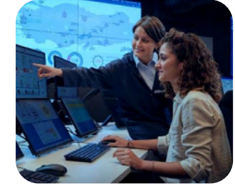
KADINLARIN İŞ GÜCÜNDE GÜÇLENDİRİLMESİ

Sabancı Gönüllüleri, geçtiğimiz üç yılda Sabancı Cumhuriyet Seferberliği kapsamındaki etkinliklere toplamda yaklaşık 170 bin saat ayırdı. Bir başka deyişle, Sabancı Gönüllüleri 19 yıllık bir çalışmayı inanılmaz bir özveriyle sadece üç takvim yılına sığdırdı.