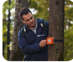
İKLİM ACİL DURUMUNA KARŞI ÖNLEYİCİ TEDBİRLER