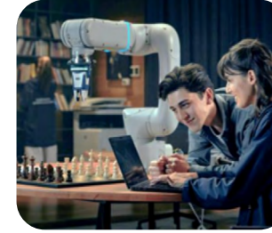
GENÇLERİN GELECEĞE HAZIRLANMASI