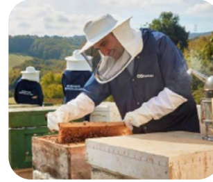
SÜRDÜRÜLEBİLİR ÜRETİM İÇİN DESTEK